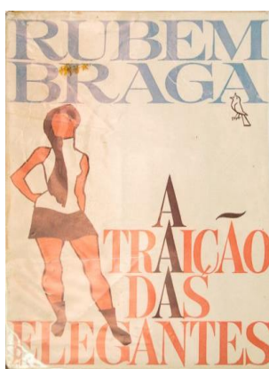
Capa da Ed. Sabiá, 1967